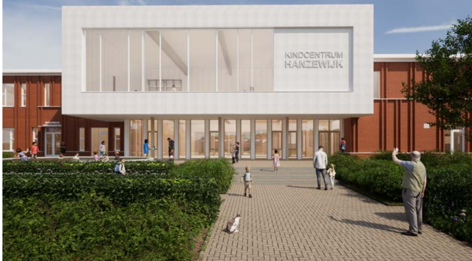
Het meest circulaire kindcentrum van Nederland

Gemeente Kampen bouwt een nieuw kindcentrum dat onderdak biedt aan twee integrale kindcentra en een gezamenlijke gymzaal. Het circulaire en bio-based gebouw is straks hét multifunctionele hart van de wijk.