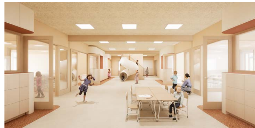
Impressie leerpleinen O.J.S. Het Scala en IKC Bouwman