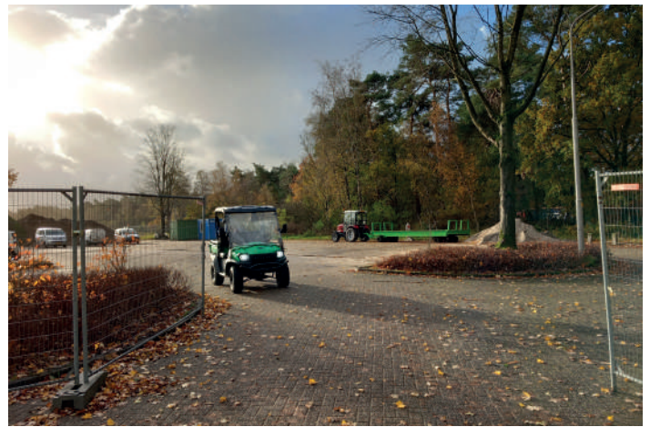
Er was sprake van emissiearm transport, gebruik makend van onder meer golfkarretjes.

Natuurlijke materiaalgebruik en lichtinval vormen de basis van het ontwerp van architect 19 Het Atelier. “Het gebouw gaat mooi op in zijn omgeving en oogt vriendelijk en transparant. Als je aan komt lopen heb je goed zicht op de ontvangstbalie, de sculpturale trap en de vides. Toch is er voldoende privacy: de wachtkamer is fraai afgeschermd met houten latten, de gangen zijn breed en de deuren naar de spreekkamers liggen in een nis”, licht Dons toe. Op de begane grond bevinden zich de artsen, fysiotherapeuten, het laboratorium en de apotheek. De eerste verdieping huisvest de tandartsen, de personeelsruimte en de technische ruimte.