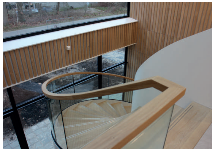
Het gebouw oogt vriendelijk en transparant.